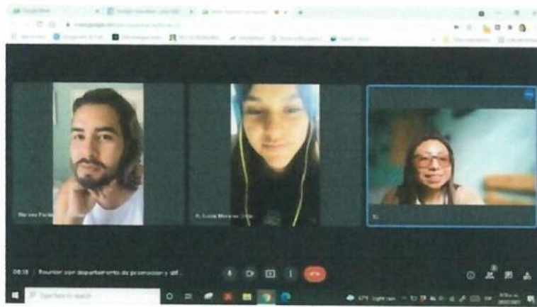
Imagen 9: Investigación para la ponencia sobre el tema de la danza de moros y cristianos, en Guatemala.