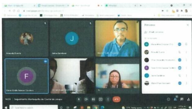
Imagen 3: Reunión virtual para dar seguimiento a la manifestación de La Nan Pa'ch, declarada como Patrimonio Cultural Intangible de la Humanidad.