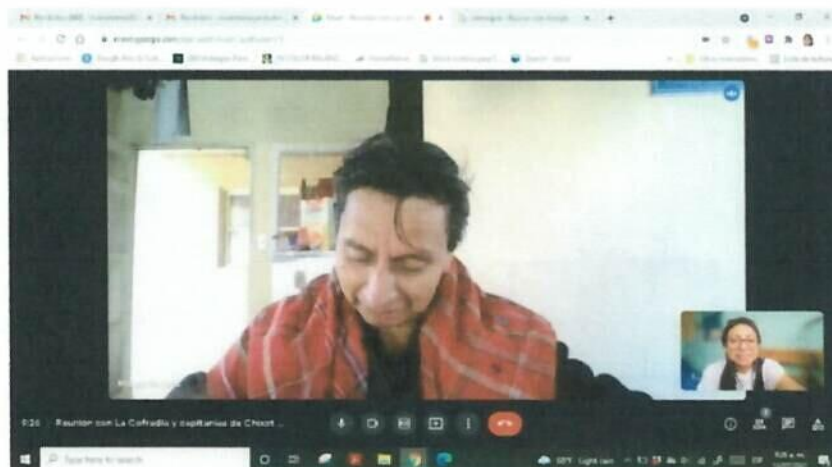
Imagen 1: Reunión virtual para dar seguimiento a la solicitud de audiencia para presentar proyectos e inquietudes La Cofradía y Capitanas de Chixot de San Juan Comalapa.