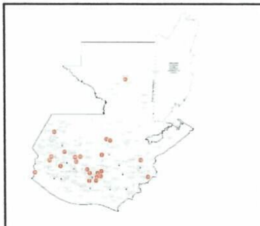
1 Ubicación PCI